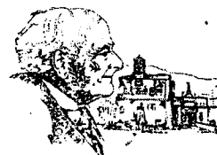
Centro di Studi e Ricerche Bartolommeo Capasso

Il Centro di Studi e Ricerche “Bartolommeo Capasso”, con il Patrocinio del Comune di Sorrento, Assessorato alla Pubblica Istruzione e Cultura, e con la collaborazione dell’Associazione F.I.D.A.P.A. Penisola Sorrentina e della Commissione Pari Opportunità del Comune di Sorrento, promuove ed organizza per il Natale 2017 la XL Edizione del Concorso